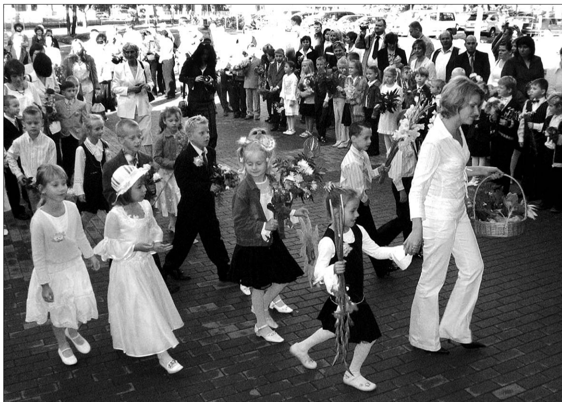
Jaunmārupes sākumskolas pirmklasnieki dodas uz savu pirmo mācību stundu.