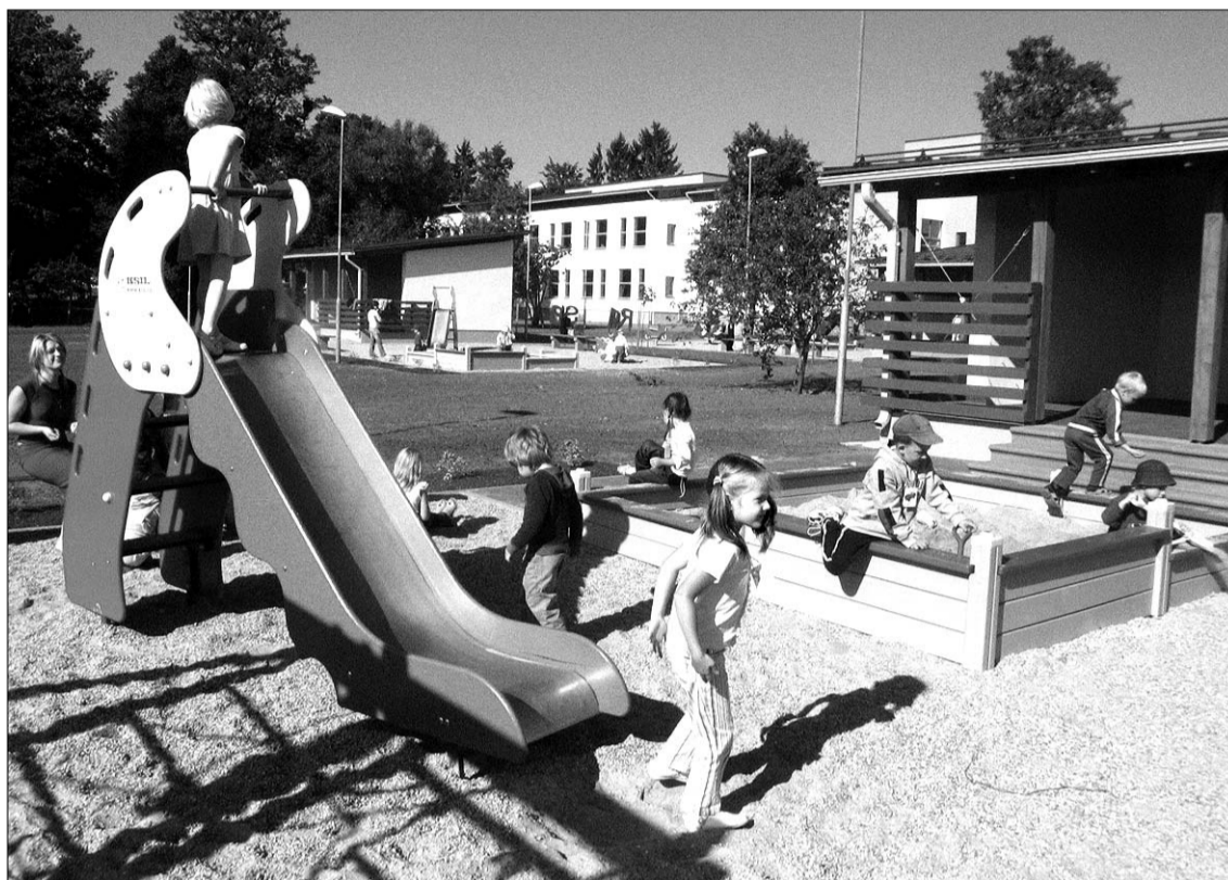
Jaunmārupes sākumskolas var lepoties ar sakopty vidi, tomēr par tās saglabāšanu esam atbildīgi mēs visi.

Līdz ar skolas atvēršanu uzsāka darbu skolas bibliotēka. Jau vasarā tika iegādātas grāmatas, metodiskā un pedagogiskā literatūra, izstrādātas tēmas, lai sko-