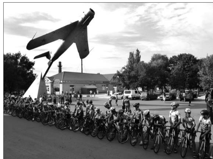
Pār starta vietu spārnus izpletusi lidmašīna.

Ja neņem vērā organizatoriskās nebūšanas, nepietiekamo ēdienu, brīžiem antisantīros sadzīves apstākļus un šausmīgo netīrību sacensību vietās, pat kūrortā, šo braucienu varētu uzskatīt par savdabīgu ekskursu pagātnē. Piemēram, mūsu puišu treniņu velnistrēnažieris, uz kura iesildīties, iz-