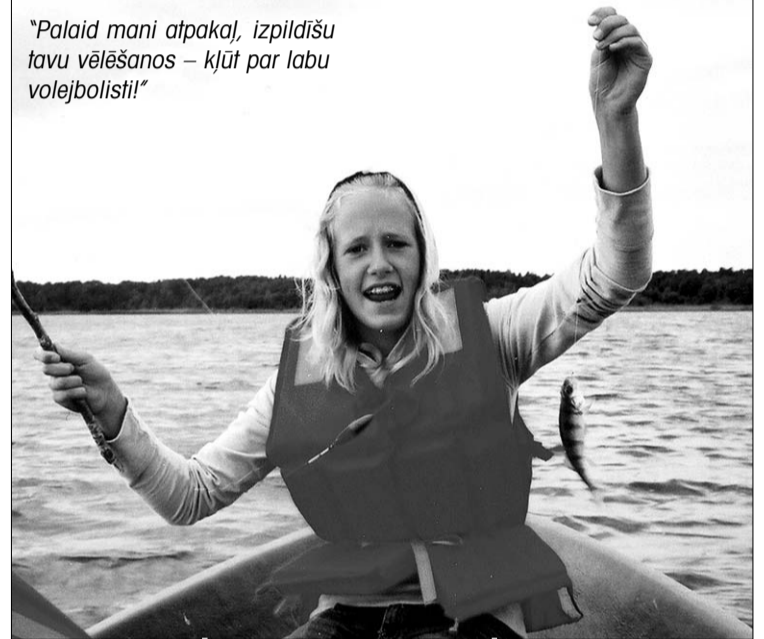
"Palaid mani atpakaļ, izpildīšu tavu vēlēšanos – kļūt par labu volejbolisti!"