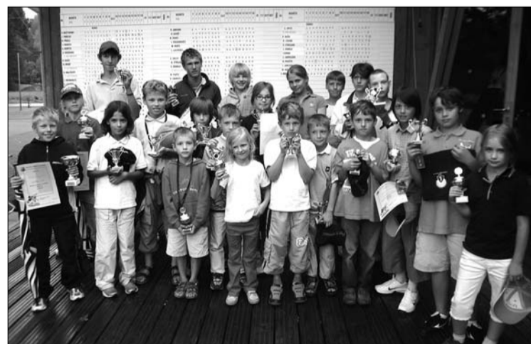
"Mārupes kausa" golfa uzvarētāji, kuru vidū ir daudzi mārupieši.