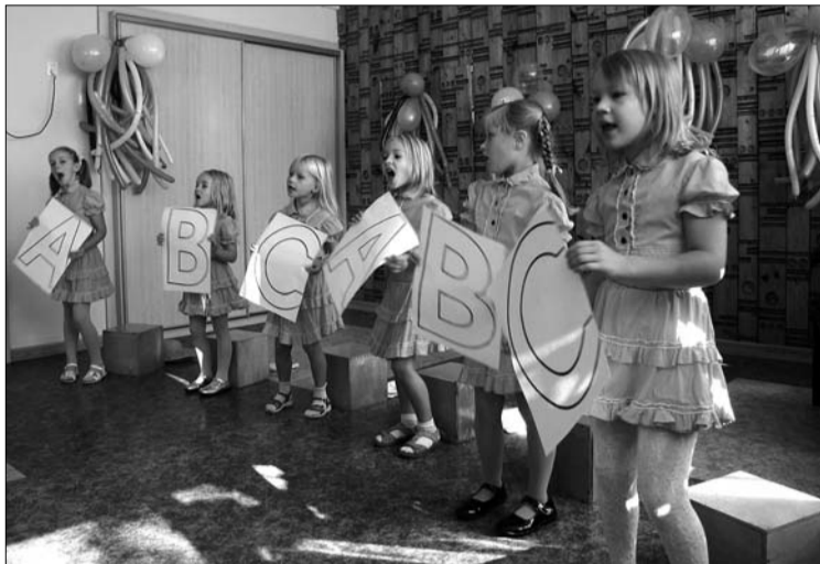
1. septembrī jaunus "Lienītes" audzēkņus sveica dziedošie "Mārupēni".

1. septembris daudziem bērniem ir diena, kad viņi mūsu iestādē atgriežas pēc vasaras atpūtas, bet citi šeit ierodas pirmo reizi. Zinību dienā ar savām dziesmām bērnus priecēja mūsu iestādes popgrupa "Mārupēni",