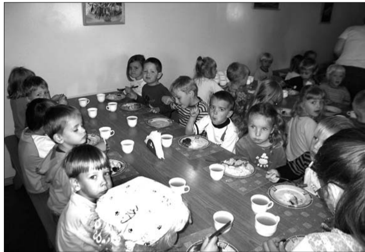
Arī mājīgajā ēdnīcā bērni māsās, kā labi uzvesties un pareizi ēst.

gatavoties mūsu tradicionālajam Miķeļdienas gadatirgum, kurš ielānāts 29. septembrī. Bērni apgūst jaunas dziesmas, dejas, vēro, noskaidro, runā par visu to, kas aug dārzā, laukā,