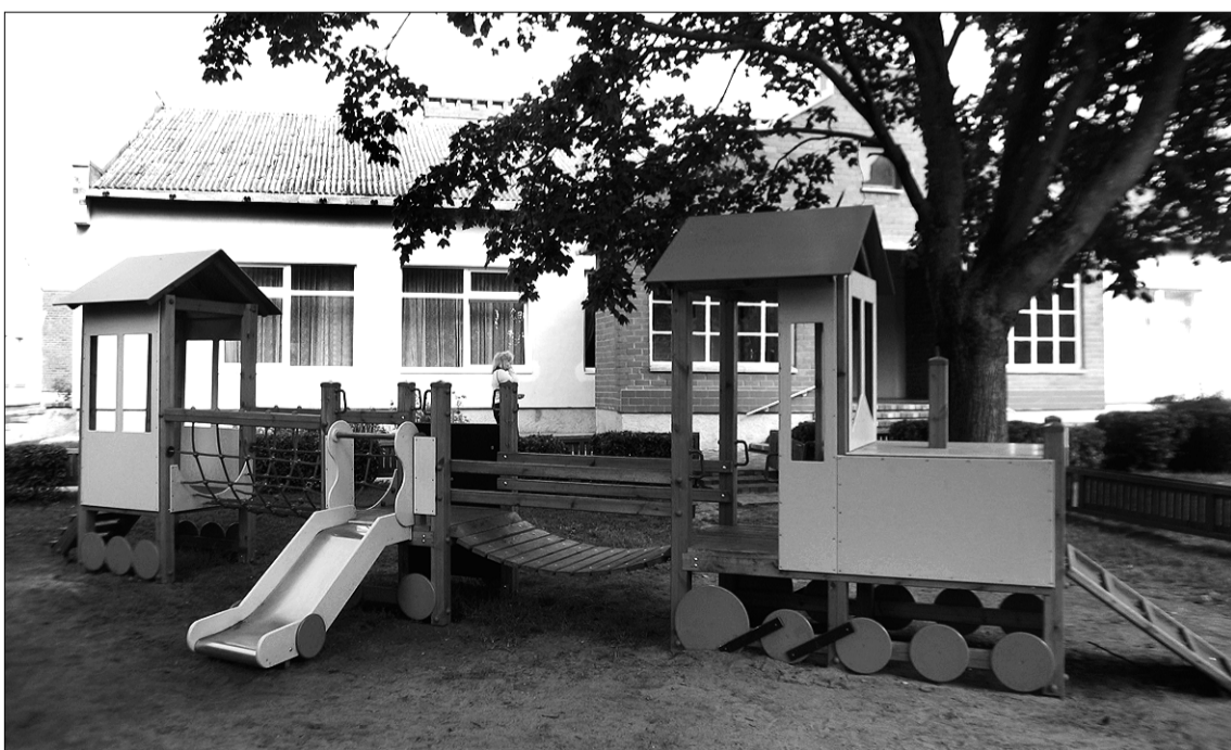
Ar jauno, košo rotaļu vilcieniņu mazie tirainieši varēs doties tālos fantāzijas ceļojumos.

Smaržo vēl pēc vasaras. Mums, pieaugušajiem, liekas – ātri gan tā pagāja, bet mazajiem droši vien šķiet – veselu mūžību vilkās. Pēc vasaras atpūtas bērnodārzs atdzīvojies, jo