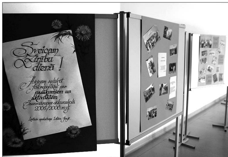
Jau pie Jaunmārupes sākumskolas ieejas visus sagaidīja sveiciens Zinību dienā un plaša fotoizstāde par pagājušā mācību gada notikumiem.

Par jaunā mācību gada sākumu Mārupes pamatskolā lasiet oktobra "Mārupes Vēstis".