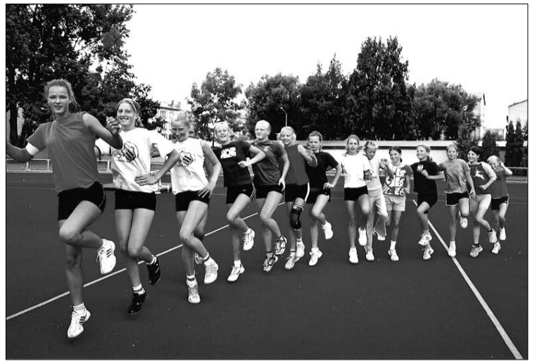
Mārupes jaunās volejbolistes treniņā nemaz neizskatās nogurušas.