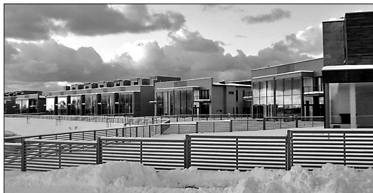
Reizē ar pirmās kārtas nodošanu "Sēļu" ciematā uzsnidzis pirmais sniegs

"Sākumā bija sapnis, tad bija ideja. Tagad tā ir pārtapusi par ceļu, kas ved uz SAVĀM mājām. Sākusi materializēties kā dzīvojamā māju ciemats Sēļi. Tā ir mūsu aizraušāns un nopietns darbs ar mērķi radīt mūsdienīgu, ērtu dzīvesvietu estētiskā vidē pavisam netālu no Rīgas centra." (Tādi vārdi lasāmi kāda jaunbūvējamā Pierīgas ciemata mājas lapā). Pats interesantākais, ka izteiktais saskan ar ciemata "Sēļi" attīstītāja – viena no lielākajiem ceļu būves uzņēmumiem Latvijā – AS "A.C.B." darbiem šajā projektā. Padomāts ne tikai, cik naudas nesīs katrs zemes un telpas kvadrātmeters, bet arī par 11,2 ha lielā ciemata teritorijas veidošanu, lai tā būtu vienota dzīves un atpūtas telpa. Par to liecina gan rūpīgi sakoptā diķa teritorija ar plānotajām dažāda līmeņa reljefa terasēm, kas dos iespēju vasarā rast veldzi, tikko izejot pa mājas durvīm, vai arī ziemā nodoties slidošanas priekiem, arī savdabīgās, askētiskās ģeometriskās arhitektūras formas ar plašām terasēm un vairākiem balkoniem, gaišiem logiem, ēku apdarē izmantots dažādu toņu koka apšuvums. Teritoriju paredzēts apzaļumot ar koku stādījumiem un košumkrūmiem, izstrādājot kopēju projektu visiem apbūves gabaliem, lai saglabātu vienotu arhitektūras un apzaļumošanas risinājumu, kā arī noteiktu servitūta ceļus, lai diķis būtu pieejams jebkuram ciemata iedzīvotājam.