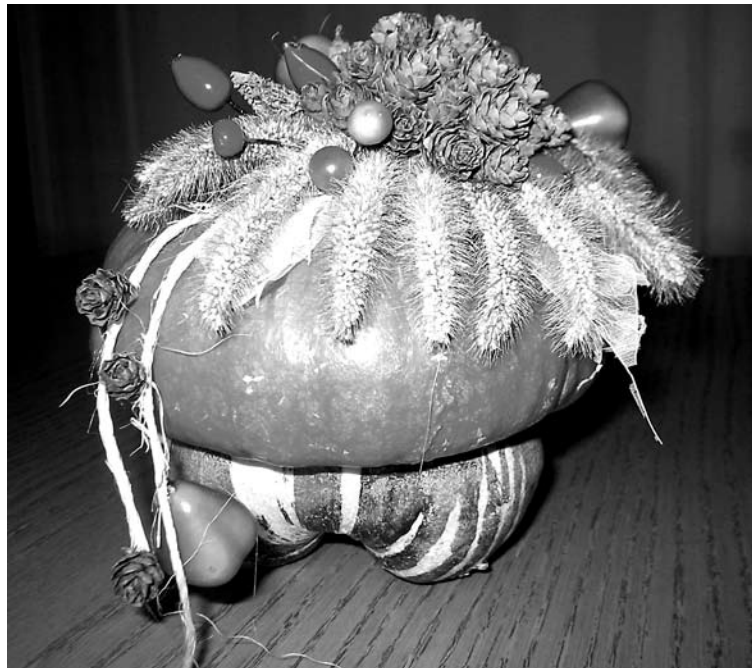
Šis mazais, dekoratīvais ķirbis nevar lepoties ar savu svaru, bet gan ar krāšņu rudens rotu.

Apaļi, koši oranži, vairākus metrus resni un smagāki par kārtīgu kartupeļu vai cukura maisu – tādi ir lielākie dārzu karaļi, kas atrasti mēnesi ilgušajā veikalā tīkla "Maxima" izsludinātajā konkursā "Latvijas lielākais ķirbis". 2. novembrī Latvijas Dabas muzeja pirmā stāva izstāžu zālē mērija un svēra 10 raženākos no 100 pieteiktajiem ķirbjiem. Lielāko Latvijas ķirbi palīdzēja noteikt dārzu audzētāju entuziastu kluba "Tomāts" speciālisti, kuri vairākus gadus septembrī un oktobrī visā Latvijā, tostarp arī Dabas muze-