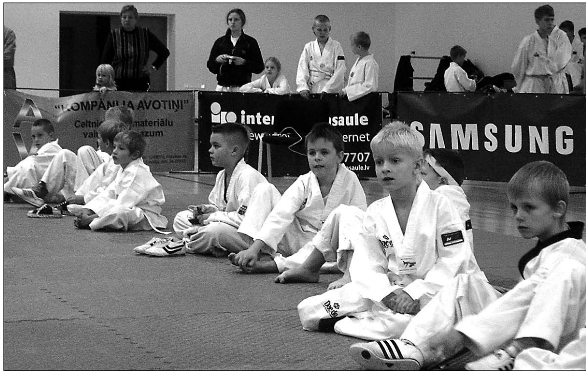
Jaunmārupes sākumskolā notika pirmās starptaustiskās sacensības teikvando.