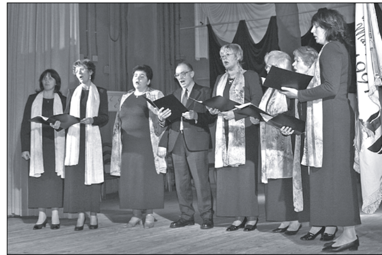
Mārupes barikāžu dalībniekus ar skanīgām dziesmām iepriecināja viesi no Allažiem – ansamblis “Liepavots”.