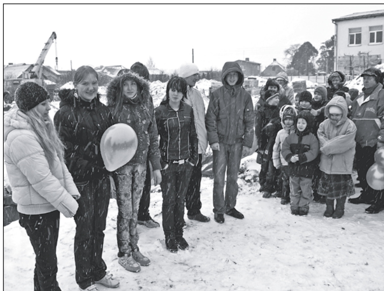
9.klases skolēni novēlēja visiem pēc iespējas ātrāk sagaidīt nodarbinātību jaunajā ēkā.