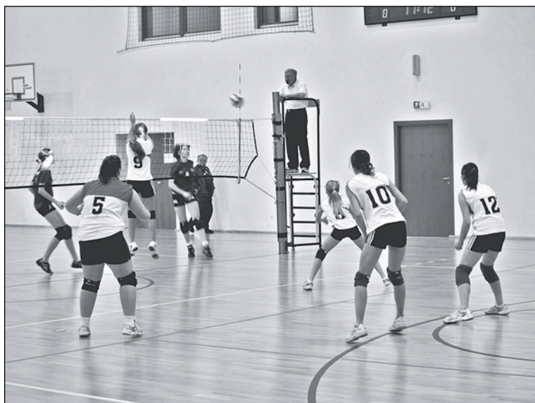
Mārupietes ar vismaz garumā galvastiesu pārākajām somietēm pirmajā spēlē cīnījās gods godam.

astoņu komandu konkurencē to pārliecinoši izkaroja, vien piekāpjoties sacensību favorītei Somijas izlasei, kuras dalībnieces pārstāvēja savas valsts ZR reģionālo izlasi. Komanda jau vairākus gadus trenējas kopā ar uzdevumu izaudzināt kandidātes nacionālajai izlasei, tāpēc arī tā komplektēta no gara auguma meitenēm no plašāka reģiona. Bet arī mūsu ziemeļu kaimiņos – Igaunijā aug slaidas meitenes. Viljandi pilsētas vienībā spēlēja 187 un 185 cm garas 1994. gadā dzimušas volejbolistes.