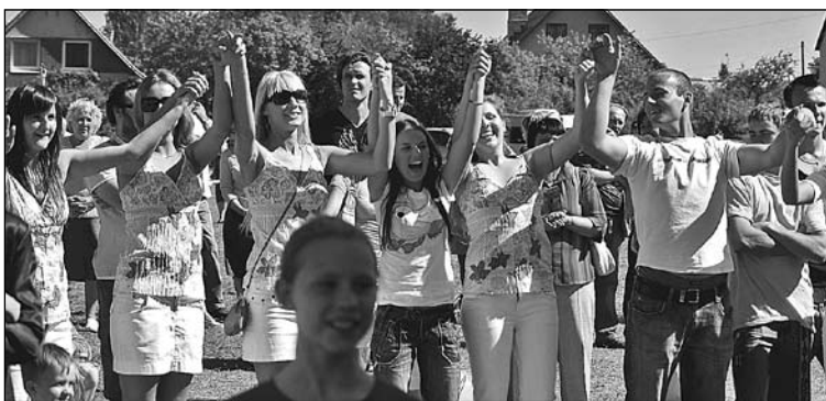
Grupas "Keen" meitenes ne tikai uzstājās pašas, bet ar draugiem aktīvi atbalstīja pārējos māksliniekus.