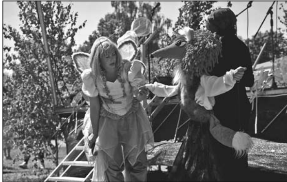
Taurēnītis un Lapsa atgādināja bērniem satiksmes noteikumus, lai vasara sagādātu tikai prieku.