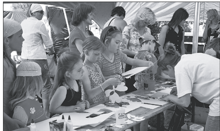
Radošajās darbnīcās dalībnieku netrūka – cepuru un masku gatavošana.

laika apstākļi mūs lutināja – saulainais laiks ar nelielu vējiņu ļāva pašā dienas vidū visiem aktīvi piedalīties svētkos, izbaudīt mūzikas, krāsu un