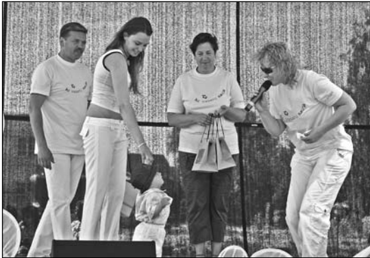
Mazajam Artūriņam tieši 1.jūnijā bija pirmā dzimšanas diena.