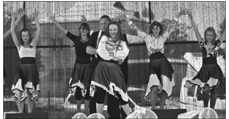
Deju grupa "Savanna" visus priecēja ar košiem tērpiem un atraktīvām skatuves dejām.