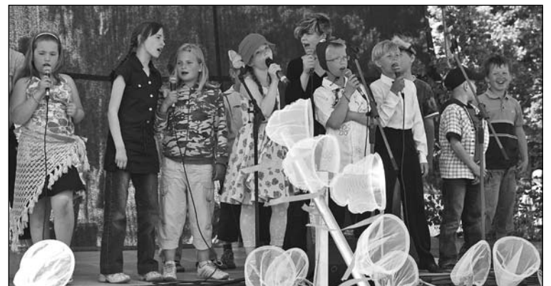
▲ Mārupes pamatskolas teātra pulciņam ar izrādi "Sniegbaltītes skola" bija pirmā lielā uzstāšanās.