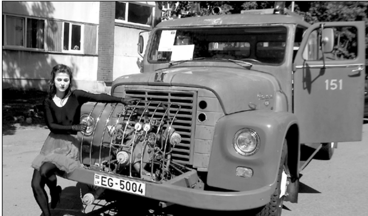
Mīmu meitene piestāvēja Cēsu alus mašīnai – 1966. gada "International 1600s".