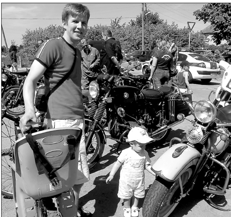
Arī pavisam jauno paaudzi interesē senie spēkrati.