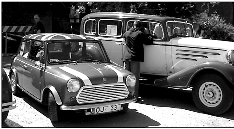
Mazulītis Austin Mini šovasar vairākas reizes esot nonācis ceļu policistu redzeslokā par ātruma pārsniegšanu.