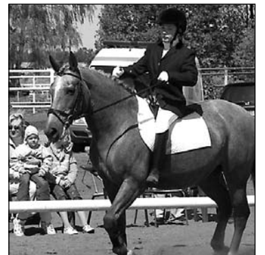
Varbūt kāds pirmo adaptīvā jāšanas sporta sacensību dalībnieks pārstāvēs Latviju Speciālajā olimpiādē

lūgtajiem un nelūgtajiem viesiem bija iespēja uzkāpt zirga mugurā, uzcienāties ar "Aldara" bezalkoholiskajiem dzērieniem un ēst "Margotas" saldējumu. Sportisti saņēma arī dāvanas no zirgu barības firmas "Eggersmann" – konfektes savam zirdziņam: ne jau šādas tādas, bet īpašas zirgu konfektes.