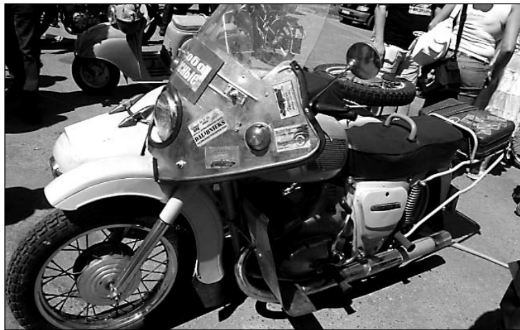
Arkādijs Ivanovs uz sava 1977. gada "IZ" salimējis visu Mārupes pasākumu dalībnieka kartes.