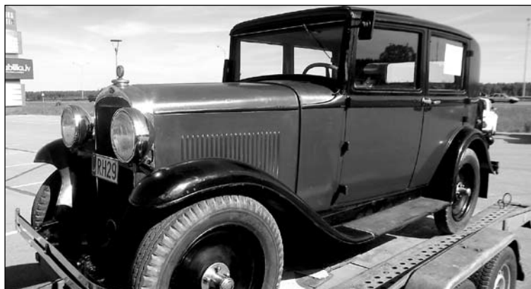
1931. gada "Opel" ir lieliski saglabāts, un visā auto 75 gadu mūžā tam ir tikai piepumpēts gaiss riepiņās. Auto ir pilnā darba kārtībā, izņemot izdegušo oriģinālo stopsignāla lampiņu.

Mūsdienās, kad ielas pilnas ar automašīnām un ikdienas steigā tik reti ir prieka un pārsteiguma momenti, šķiet, gandrīz nevienam neatstāj vienaldzīgu skaists retro auto. Biežāk tos redzam vasarā vizinām kāziniekus, jo daudzi no šiem spēkratiem ir kabrioleti, kas pilnā mērā ļauj izbaudīt sauli un vēju. Bet Latvijas siltajā sezonā vairākas reizes šos skaistos tehnikas brīnumus (daži no tiem ripo pa ceļiem jau vairāk nekā 70 gadus!) lielākā skaitā vienopus var aplūkot dažādos seno spēkratu pasākumos.