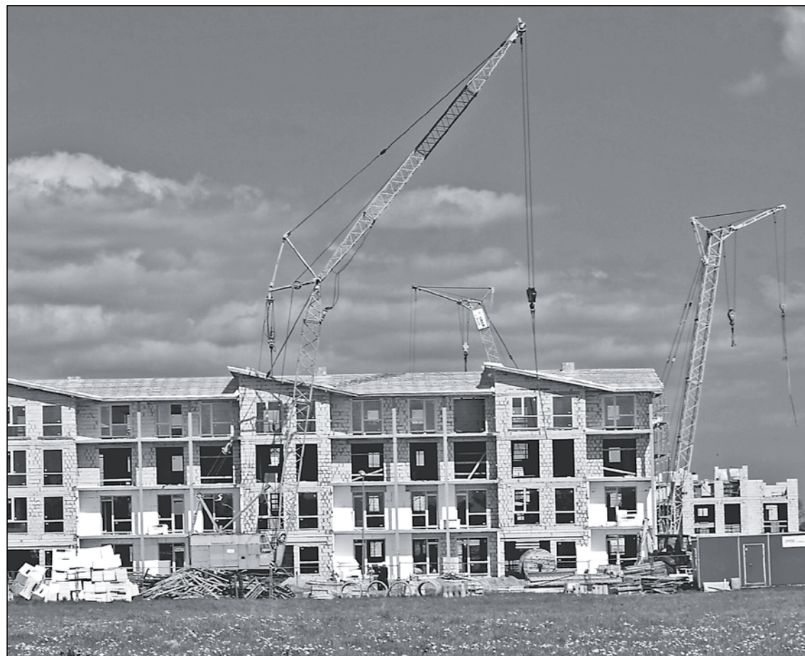
Ar katru gadu Mārupē pieaug namu un iedzīvotāju skaits.

Analizējot budžeta ieņēmumu daļu, arī iedzīvotāji var redzēt, cik būtiski ir deklarēt savu dzīvesvietu pašvaldībā, kurā dzīvo, jo nekustamā īpašuma nodoklis (NĪN) un nodoklis par ēkām un būvēm kopā veido tikai nepilnus 8% no budžeta ieņēmumiem. Nākotnē arī šie nodokļi pieaugs – Valsts Zemes dienesta mājas lapā katrs īpašnieks var iepazīties ar sava īpašuma jaunajam kadastrālajam vērtībām un nodokļu maksājumu summu nākotnē. Bet šobrīd valdošā aiztātība un neziņa par nodokļa lielumu ir lieka: šajā gadā NĪN palielinā-