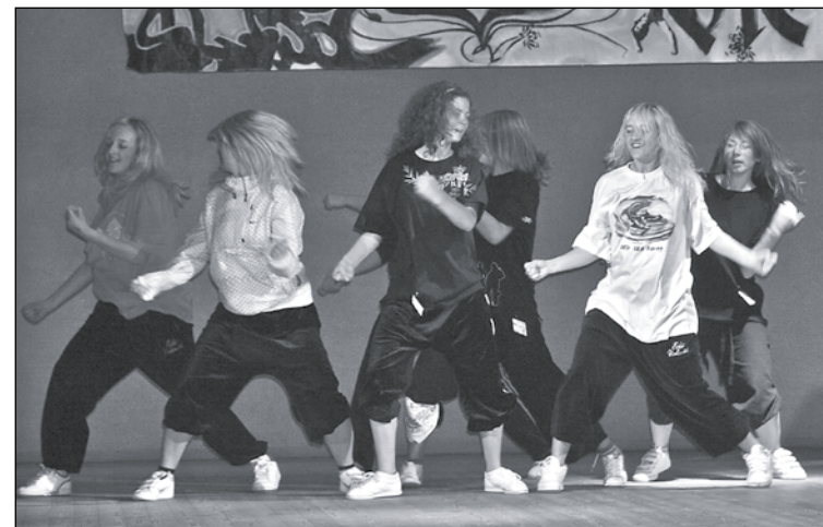
Paraugdemonstrējumi uz skatuves.