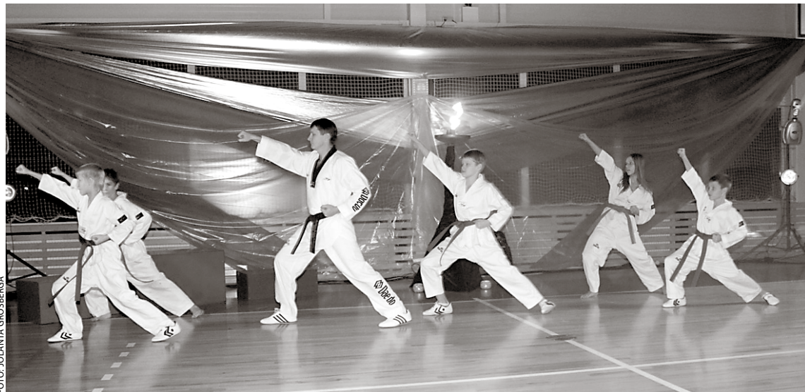
Priekšnesumu sniedz teikvando sekcijas audzēkņi un treneris.

Sveicam vēlreiz visus laureātus un novēlam veiksmi, izturību un jaunus panākumus nākamajās sacensībās un 2010. gadā!