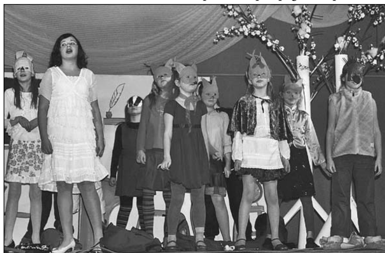
Decembrī Rīgas 4. mūzikas un mākslas skola viesojās Mārupē ar savu muzikālo izrādi "Sniegbaltītes skola".

JANVĀRĪ – kā ik gadu piemiņām 1991. gada barikāžu dienas –