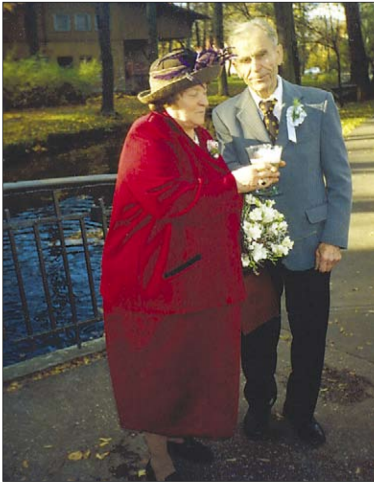
No kāzām pirms 50 gadiem nav nevienas bildītes. Zelta kāzās bērni un mazbērni Redzobu pārim dāvināja svētkus.

"Mēs toreiz fermā četras slaucējas – visas bārenes bijām, katrai pa 12 govīm jākopj, ūdeni ar nēšiem – slapjš vai slidens – bija jā-