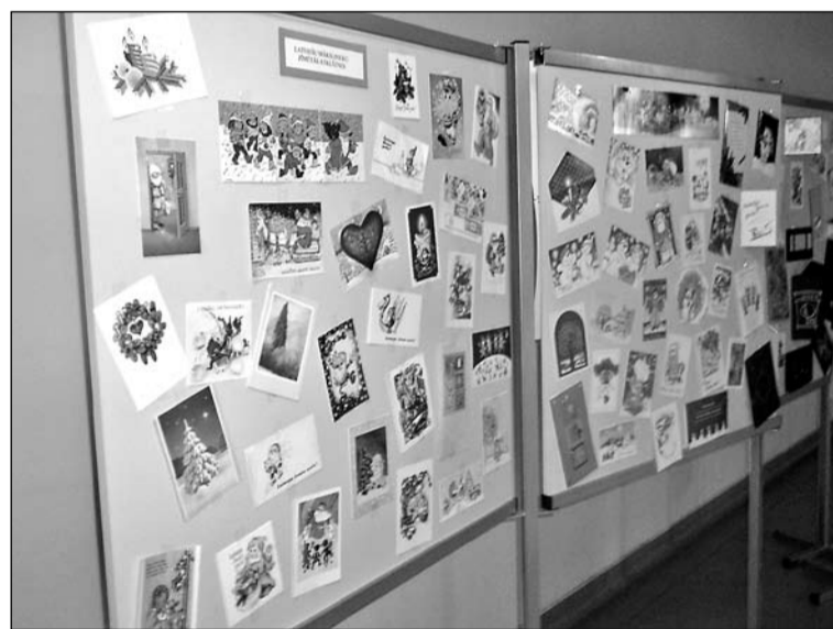
Simtiem Ziemassvētku apsveikumu rotāja sākumskolas vestibulu.

Neskatoties uz to, ka šogad Sniega māte aizkavējusies un piemirsusi sapurināt savus spilventiņus, Jaunmārupes sākumskolā jūtama gatavība sagaidīt ziemu un Ziemassvētkus.