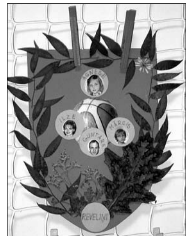
2. klašu audzēkņi veidoja savas ģimenes ģerboņus.

Skolas bibliotekāre Zinaīda Spāde ar atzinības rakstiem pateicās