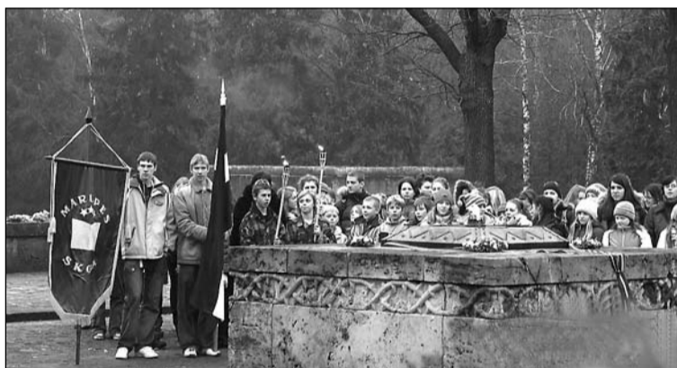
Mārupes vidusskolas skolēni pie Brāļu kapu mūžīgās uguns.

17. novembrī, kā ierasts, Mārupes vidusskolas skolēni un darbinieki atzīmēja Latvijas gadadienu. Pērn tika apmeklēts Vēstures un Kara muzejs, un nolikti ziedi pie Brīvības pieminekļa. Zinot, ka Latvijas neatkarības izcīnīšanas un nacionālās pašapziņas simbols ir Brīvības pieminekļi un Rīgas Brāļu kapi. Šogad 5. – 12. klases skolēni un viņu skolotāji brauca uz Rīgas Brāļu kapiem.