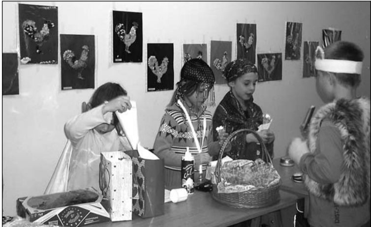
Mārtiņdienas gadatirgū bērni varēja iejusties gan pārdevēju, gan pircēju lomās. Pie sienas – Mārtiņu gaiļi.

Sagaidot valsts svētkus, Jaunmārupes sākumskolas audzēkņi sagatavoja vairākas izstādes, kuras bija apskatāmas skolas vestibilos. 1. klašu skolēnu un viņu vecāku radošo darbu izstādē "Mana Latvija" bija apskatāmas izdomas bagātas Latvijas kartes, kurās neparastiem materiāliem raksturots katrs novads. Izgatavojot šīs neparastās kartes, bija izmantoti dažādi dabas materiāli: akmeņi, gliemežvāki, ķērpji un koku mizas, ziedi, lapas, arī grūbas, griķi, risi, lauru lapas un ķimenes, pupas, zirņi, popkorns vai Kellog's pārslas, dzija u.c. Izstādē piedalījās 34 darbiņi.