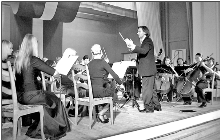
J. Mediņa mūzikas skolas jauniešu simfoniskais orķestris Mārupē.

17. novembrī ar brīnišķīgu muzikālu pārsteigumu tika iepriecināti Mārupes pagasta padomes darbinieki, izglītības iestāžu pārstāvji, bijušie pašvaldības darboņi un pašdarbības kolektīvu vadītāji, kas bija aicināti Mārupes kultūras namā uz svētku sarīkojumu.