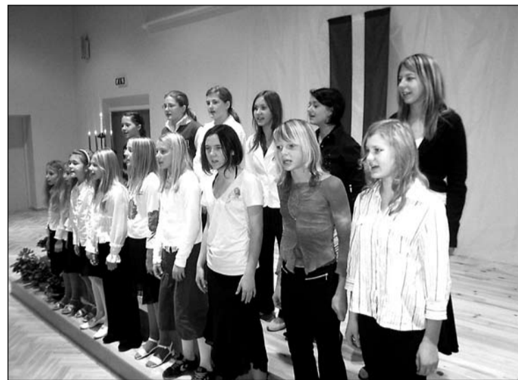
Mūzikas skolas ansamblis.