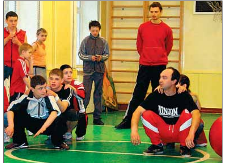
Pa labi – Grizānu ģimenes komanda, pa kreisi – "Makaroni", aizmugurē sacensības vēro "Trio+" tētis.