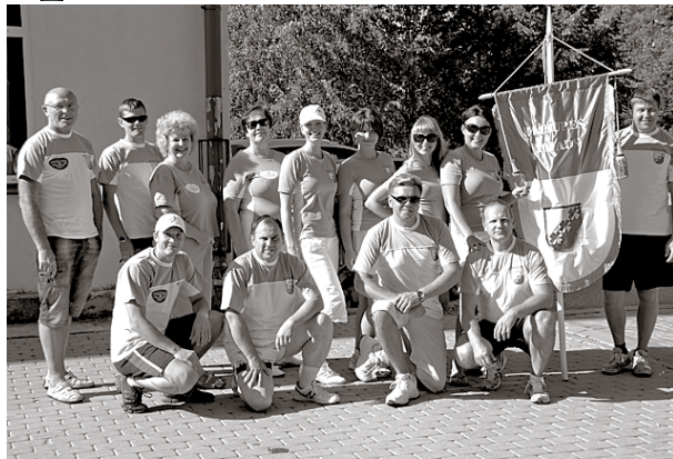
Mārupes pašvaldības komanda

Ropažos sestdienā – saulainā un siltā vasaras izskaņas dienā – norisinājās Pierīgas pašvaldības darbinieku vasaras sporta spēles. Mārupes novads sīvā cīņā un ar draudzīgu atbalstu kopvērtējumā starp 10 pašvaldībām pirmo reizi sporta spēļu vēsturē izcīnīja godpilno 3. vietu!