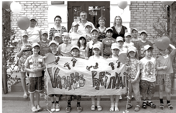
Nometnes dalībnieki ar pašdarināto nometnes karogu