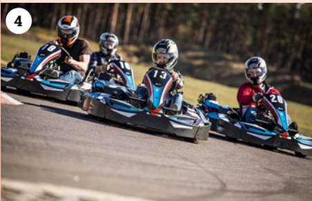
4 Sila Priedes, Ropažu novads, LV2133 www.333.lv ✉ info@333.lv +371 29555333 📍 GPS 56.9503974, 24.4104722

В ансамбль культурного наследия крепостного холма Ропажы входит средневековый замок Ропажы, построенный в 19 веке Дом священника, средневековое кладбище, место церкви Св. Михаила и Ропажий поселок. Средневековый замок Ропажы был ливонским отделением немецкого ордена построенный в начале 14 века. Туристам предлагается увидеть живую историю с целью познакомиться со средневековой жизнью, древними ремеслами и военным искусством. Предлагается так же экскурсии с "живой историей" и по Культурно-историческим ансамблем крепостного холма Ропажы.