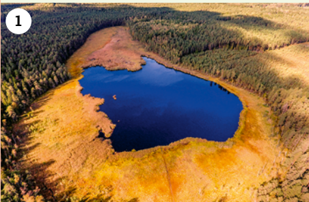
1 Dabas liegums "Lielie Kangari", Ropažu novads www.ropazi.lv ✉ turisms@ropazi.lv +371 29335523 📍 GPS 56.919732, 24.730131