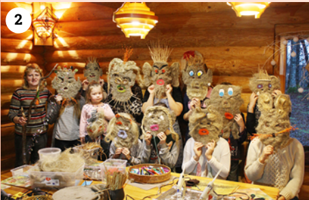
2 Sauleskalns, Ropažu novads, LV-2133 www.sauleskalns.lv ✉ ievameijere@inbox.lv +371 29403887 📍 GPS 56.9677295, 24.5131295

Природный заповедник "Большие Кангари" а также прилегающая площадь – озеро Кангари и болото Лилекангари расположены у подножия самой большой части хребта Латвии. На территории находится смотровая башня высотой 33 м и смотровая площадка для наблюдения прилегающих территорий. В заповеднике есть прогулочная тропа длиной менее 2 км с информационными стендами про особо охраняемые и редкие виды животных и растений. В начале тропы находится маршрут здоровья, включающий упражнения, которые подходят для каждой возрастной группы. Вход свободный. Для похода через болото на специальных лыжах и для экскурсии с гидом необходимо записаться заранее.