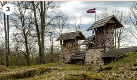
3 Ropažu Livonijas ordeņa pilsdrupas, Ropaži, Ropažu novads www.ropazi.lv ✉ turisms@ropazi.lv +371 29335523 📍 GPS 56.978848, 24.630322

Место отдыха для всех – семей, учеников, активных людей и тех, кто хочет что-либо спраздновать или отдохнуть. Комплекс отдыха "Saulkalns" предлагает широкий выбор развлечений: Тропа Латвийских праздников, аттракционы для детей, школьные экскурсии, баня, поездка на лодке по Большой Югле, спортивная площадка, игра кануполо, Ремесленный дом с различными творческими мастерскими, тур по бездорожью на джипах и лазерный пейнтбол. По предварительной записи.