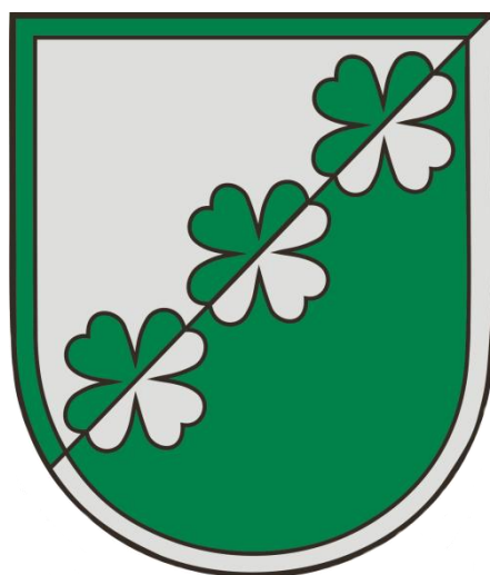
Mārupes novada karogs